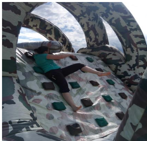
Une de nos enseignantes testant le parcours