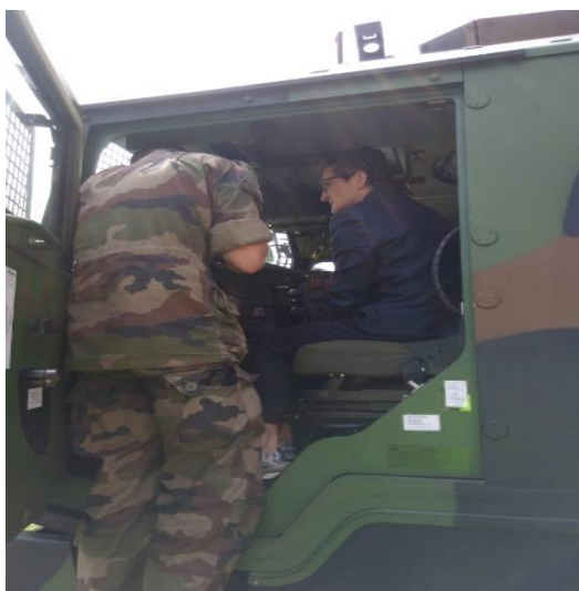
Mme le proviseur au volant d'un PPLOG

Le « TIOR » est le sport de combat des armées. Les TIOR sont inspirés des autres sports de défense, de la boxe au krav maga. Il est utilisé lors des opérations extérieures et de l'opération Sentinelle . Les militaires peuvent ainsi neutraliser leurs adversaires avec des moyens adaptés à la situation, à l'aide de coups d'arrêt, mises au sol, ripostes ou encore esquives.