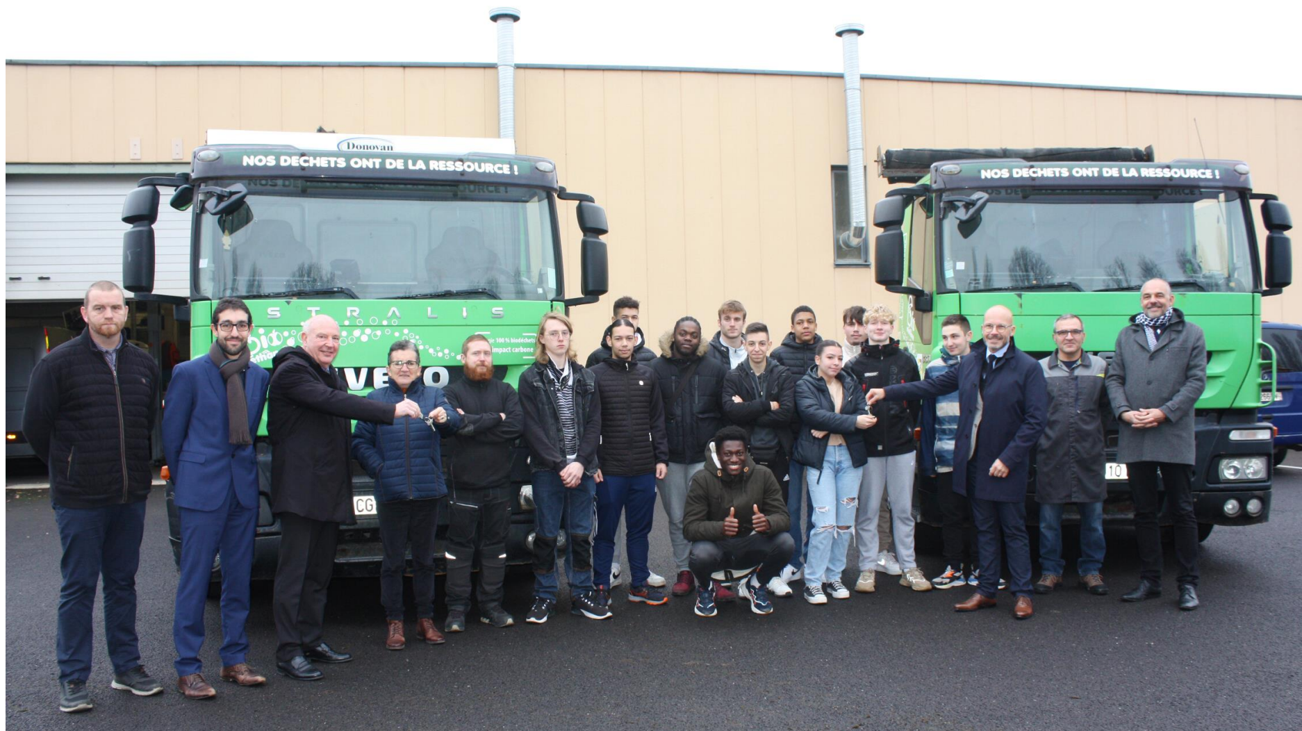
Remise officielle des clés des 2 camions au lycée Eiffel de Talange